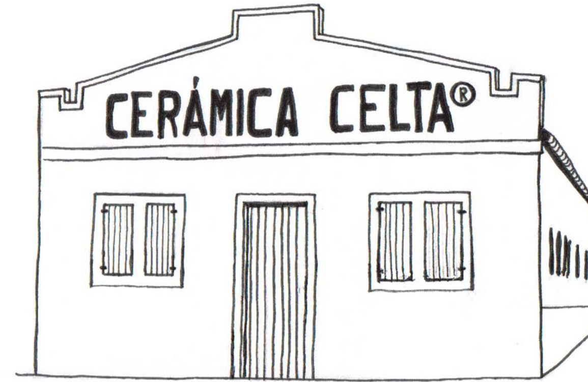
(1) Fábrica de cerámica / Pottery works