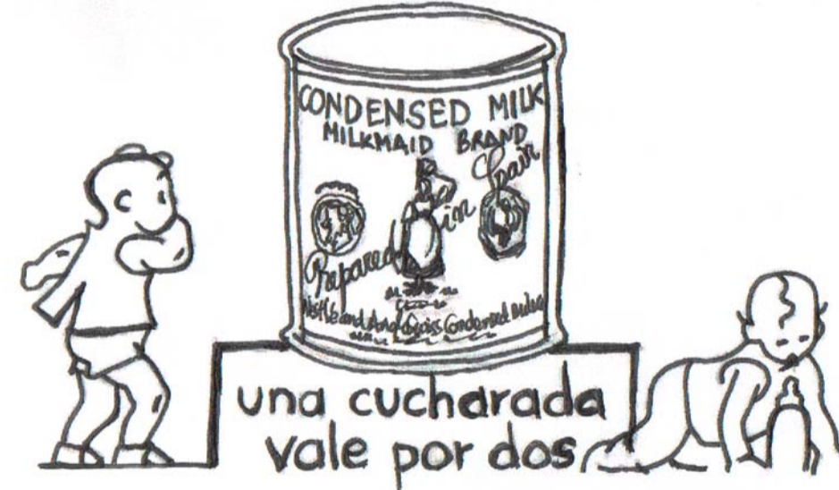
(3) Fábrica de leche condensada / condensed milk Plant